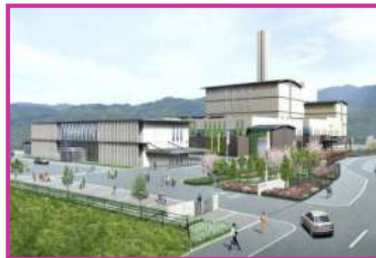
〈完成予想図（パース）〉